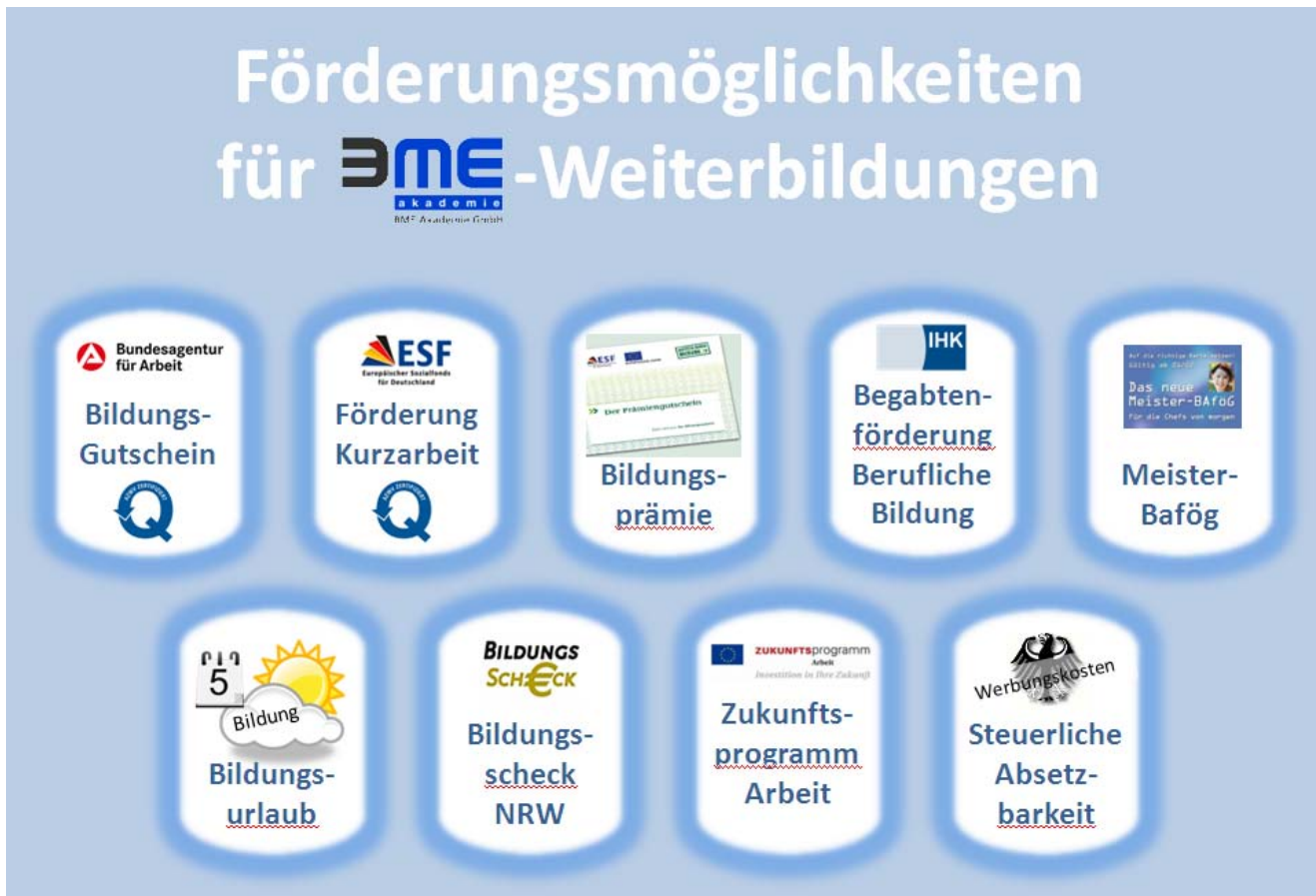
Abb. 1: Förderungsmöglichkeiten im Überblick

Folgende Förderungsmöglichkeiten bieten sich bei BME-Weiterbildungen: