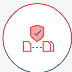
Abbildung komplexer Prozessflüsse dank fortschrittlicher Werkzeuge für externe Schnittstellenkopplung und Programmintegration