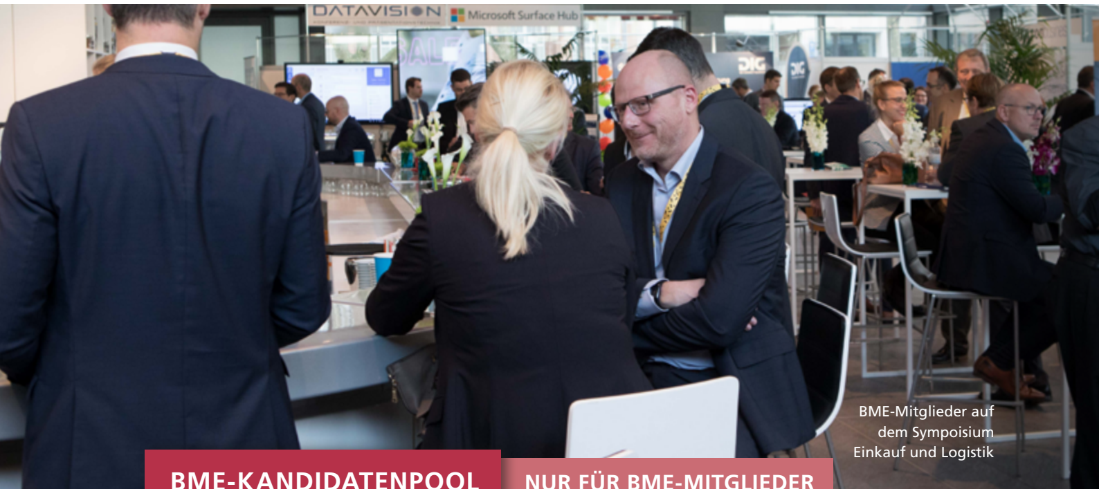
BME-Mitglieder auf dem Symposium Einkauf und Logistik